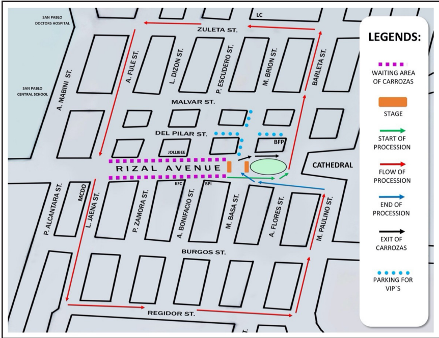
Mapa ng Ruta ng Magkahiwalay na Prusisyon sa Lungsod ng San Pablo