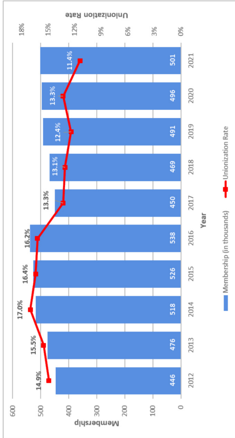
Figura 2. Trend sa Lebel ng Unyonisasyon at Bilang ng Mga Miyembro ng Unyon sa Publikong Sektor, 2012-2021

Pinagkunan: Bureau of Labor Relations, 2021